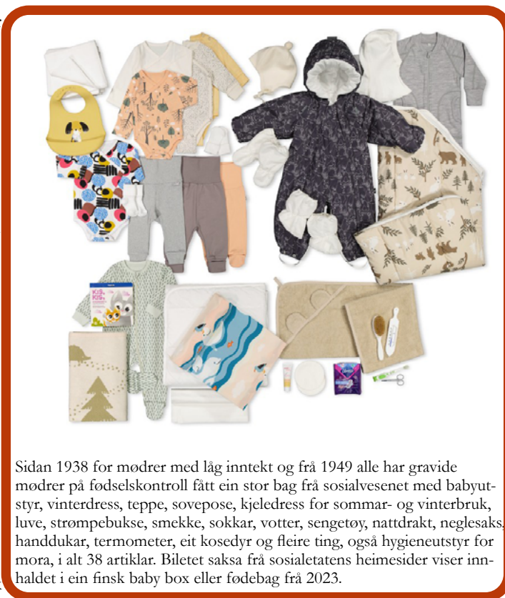
Sidan 1938 for mødrer med låg inntekt og frå 1949 alle har gravide mødrer på fodselskontroll fått ein stor bag frå sosialvesenet med babyutstyr, vinterdress, teppe, sovepose, kjledress for sommar- og vinterbruk, luve, strømpebukse, smekke, sokkar, votter, sengetøy, nattdrakt, neglesaks, handdukar, termometer, eit kosedyr og fleire ting, også hygieneutstyr for mora, i alt 38 artiklar. Biletet saksa frå sosialetatens heimesider viser innhaldet i ein finsk baby box eller fødebag frå 2023.

Finland har også no ein omfattande matberedskap, såleis med matkorn for seks månader og såkorn for fleire år, og spreidd utover i landet og med vekt på beredskap på gardane. Medan rundt ein av 50 yrkesutøvarar i Norge, Sverige og Danmark arbeider innan landbruk, er andelen framleis dobbelt så høg, ein av 25, i Finland. Sjølvforsyningsprosenten er nesten 80, mot 40 her.