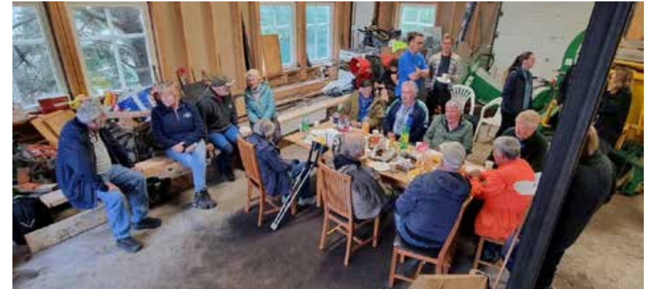
Mat og prat på Bildøy etter HMS-arrangementet.