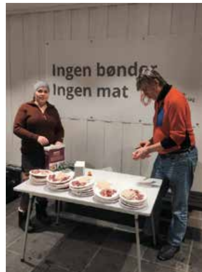
Masfjorden BS viste filmen "Sau" i samarbeid med Bygdekinoen. Serverte spekemat med tilbehør til dei som var på kinoen.

I fleire av lokallaga føregår det aktivitetar for både medlemmer og andre. Her er litt av kvart som kanskje kan vere til inspirasjon for fleire.