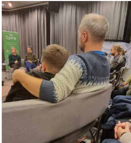
Ungdommen er med