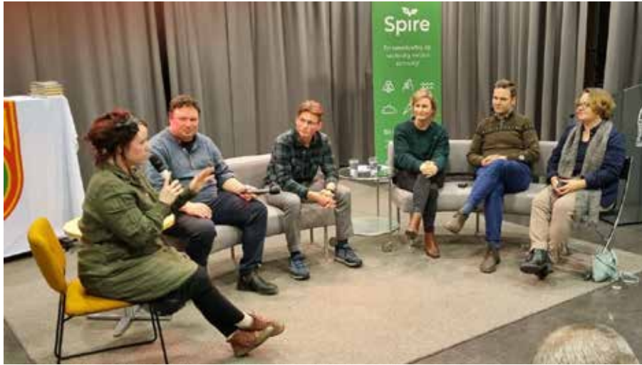
Mari leiur debatten mellom representantar frå NBS, MDG, SV, SP og V.