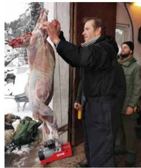
Då Midthordland BS arrangerte slaktekurs var det ventelister for å få vere med.