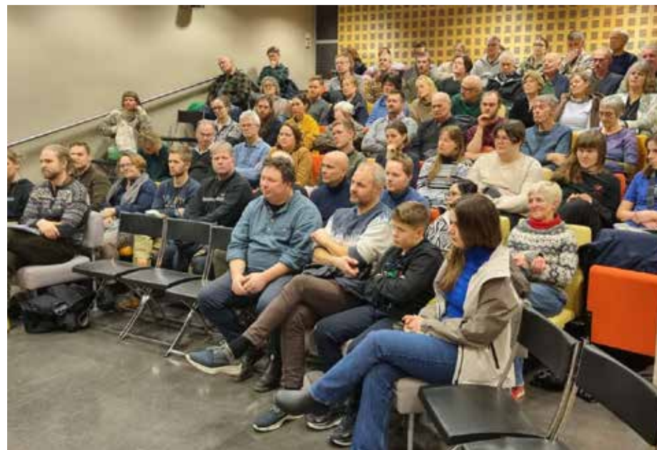
Fullsett sal under møtet på Bergen Bibliotek.