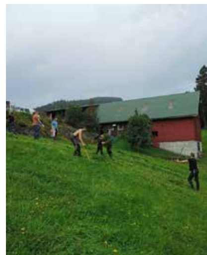
Kurs i ljàslått. Midthordland BS.