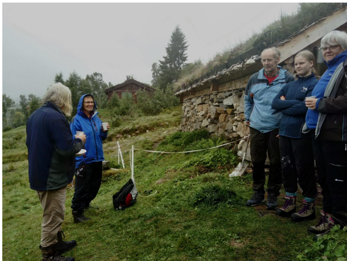
Sommarutflukt til Åndalssetra i Gjemnes og Tingvoll BS i august 2020