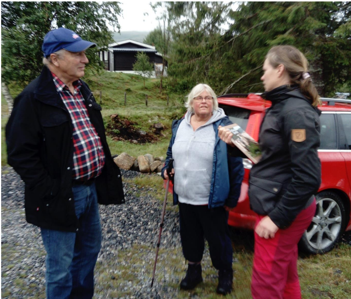
Seterbrukarar i ivrig prat om setring og vestlandsk fjordfe

Vi skal arbeide for å bli aktive på hjemmesida og i media og utvide informasjonen til lokallag og medlemmer. Fylkesstyret fremmet et budsjettforslag med en kostnad på kr 275.000 og en inntekt på kr.327.000 . Årsplan og budsjett enstemmig vedtatt av fylkesårsmøtet.