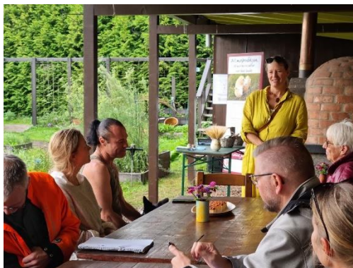
Fra foredraget.

Lørdag 23. september var vi invitert til åpningen av ØKO-uka i Østfold på Månegartnereiet i Fredrikstad der tema var « Skolehagen som pedagogisk læringsarena og betydningen den har for skolebarnas hverdag og for framtidens matproduksjon og nasjonal sikkerhet »