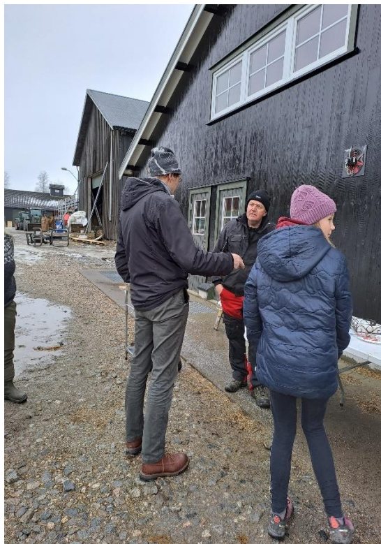
En prat ved grillen.

Så tok vi for oss rutiner for å avdekke og rette opp feil, bl.a