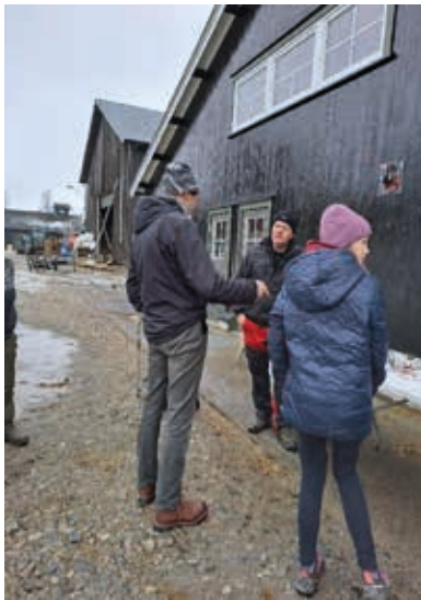
En prat ved grillen.

Så tok vi for oss rutiner for å avdekke og rette opp feil, bl.a