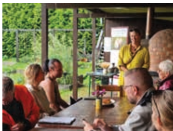
Fra foredraget.

Lørdag 23. september var vi invitert til åpningen av ØKO-uka i Østfold på Månegartnereiet i Fredrikstad der tema var «Skolehagen som pedagogisk læringsarena og betydningen den har for skolebarnas hverdag og for framtidens matproduksjon og nasjonal sikkerhet»