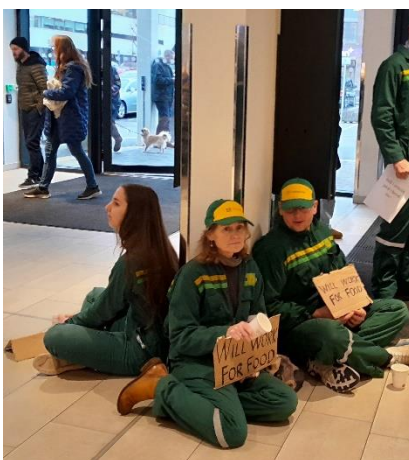
Aksjon WILL WORK FOR FOOD Hamar under landsmøtet.

Note 7: derav 30 t-skjorter o.a.profileringsutstyr kr. 12546