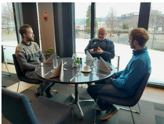
Frå Ungdomssamlinga i Ørsta